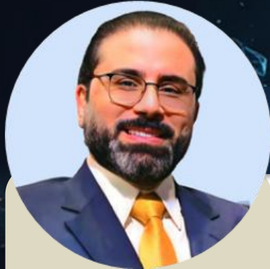
رئيس مجلس التنمية العراقي