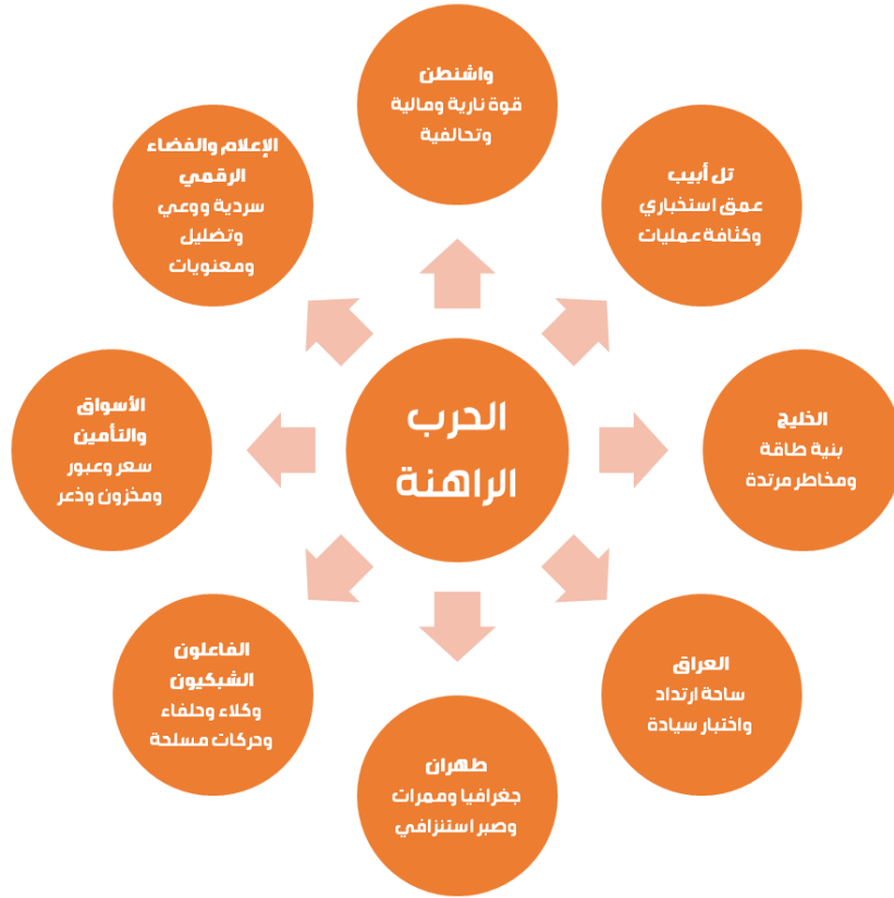
الشكل ٥ شبكة الفواعل ومستويات التأثير