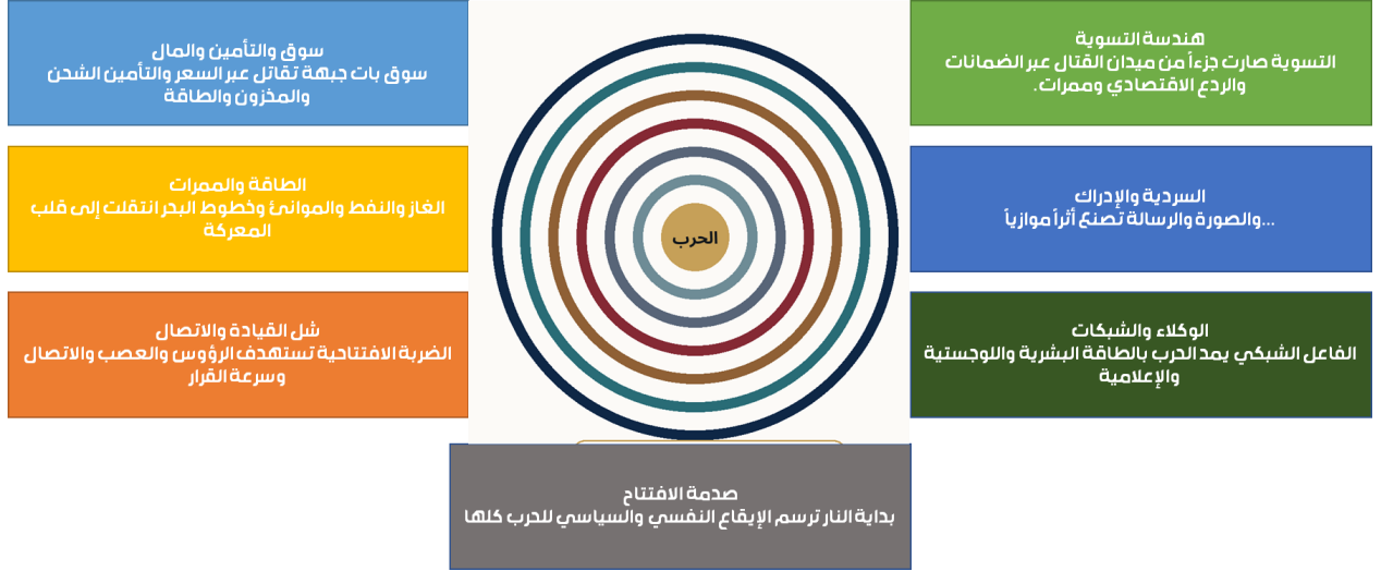
الشكل 1 نموذج الحلقات السبع للصدام المركب

المصدر: صياغة تحليلية أصلية مستندة إلى وقائع الحرب الراهنة وإلى أدبيات الحرب متعددة المجالات والحرب الإدراكية