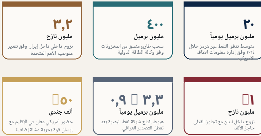
الشكل ٣ بطاقات الصدمة الإقليمية والعالمية