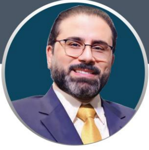
رئيس مجلس التنمية العراقي